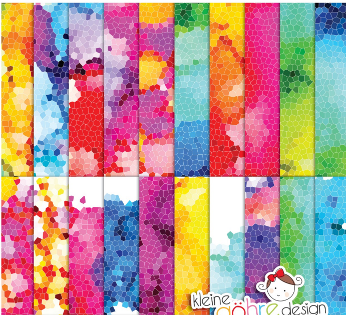
digitale Papiere "Mosaik Farbexplosion Muster3"