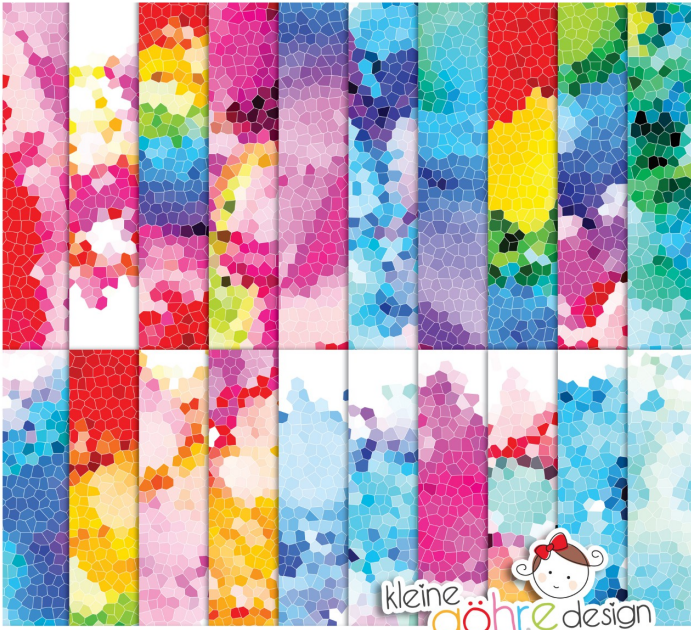
digitale Papiere "Mosaik Farbexplosion Muster1"