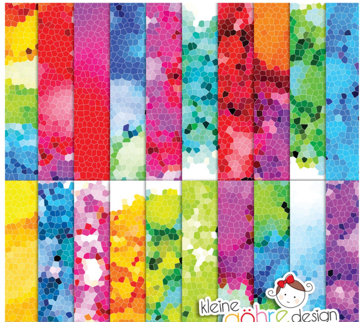
digitale Papiere "Mosaik Farbexplosion Muster4"